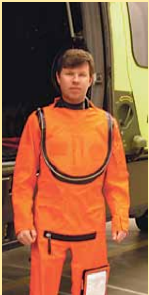
Roskilde Lufthavn Vi har besøgt den lille nabo Læs mere på side 6