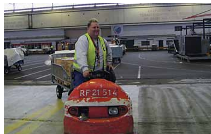
Spirit får seniorordning som led i nye lokalaf-taler.

Novia og Sprit har fået mere frihed, og hos Novia og CFS tillidsmandsbeskyttelse af næstformand i klubben.