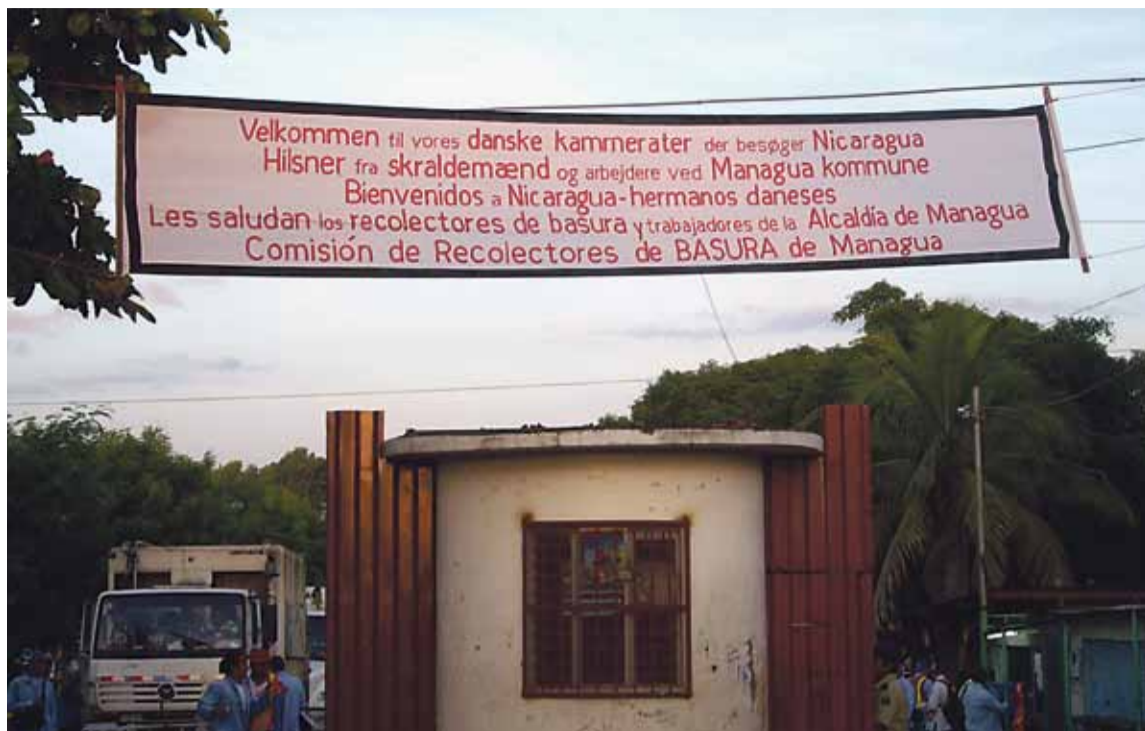
Skraldemændene har lang tradition for at hjælpe skraldemænd i Nicaragua.