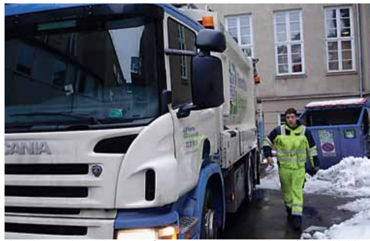
Skraldemændene i de tre nye firmaer har valgt TR og lavet faglige klubber.

Der har selvfølgelig været nogle driftsmæssige udfordringer alle steder, men vi har løst udfordringerne via en god dialog, og kan alle steder