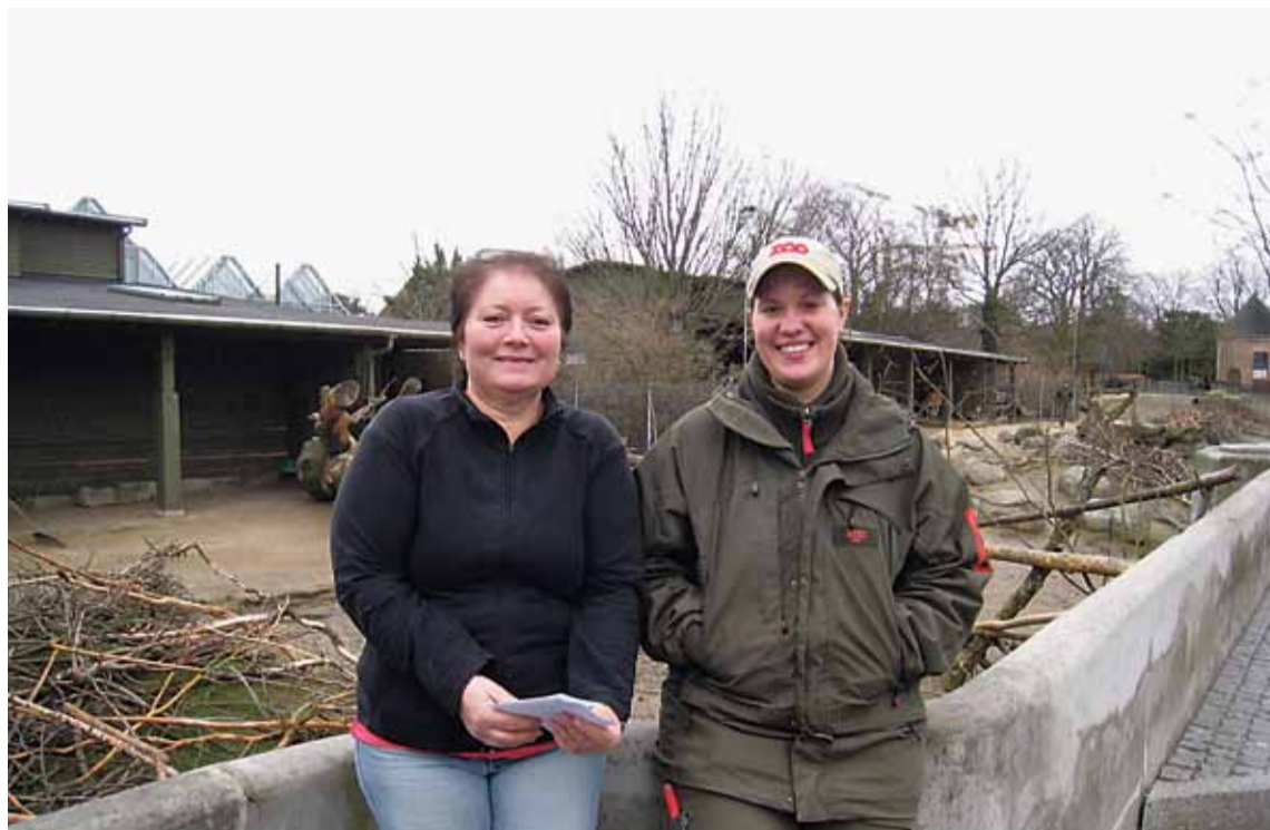
Brug opsigelsen til kurser. Det er meget federe end at gå og være opsagt.

„Det er godt at kunne, når man skal videre,” siger hun.