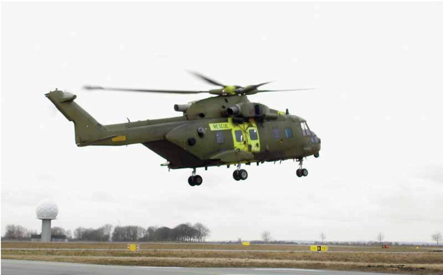
Flyvevåbnets redningshelikopter af typen EH-101 Merlin.

Vidste du, at ingen ved hvordan en helikopter kan flyve? Men der er to fremherskende teorier. Den første går ud på, at roterbladene pisker luften til underkastelse, mens den anden går ud på, at helikoptere er så grimme, at de frastøder jorden.