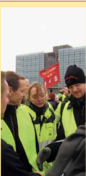
3F'ere nedlagde overenskomststridigt arbejdet i protest mod dårlige forhold og truslen om at afskaffe efterlønnen Se mere på side 5