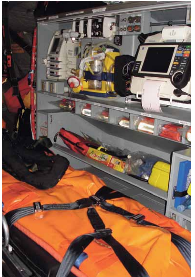
Det medicinske udstyr i helikopteren ligner meget det der er i almindelige ambulancer.

kopterne en del af Flyvevåbnets Eskadrille 722.