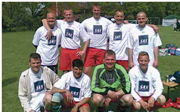
Her ses sidste års stolte vindere i oldboysgruppen fra SGH.

3F Kastrup inviterer medlemmerne til uddannelsesdag torsdag den 12. maj kl 9 til 17 i mødesalen på Saltværksvej 68