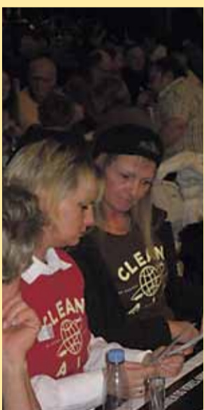
Efterløn Regeringens forslag om afskaffelse har sat gang i debatten Læs mere på side 10 og i lederen på side 3