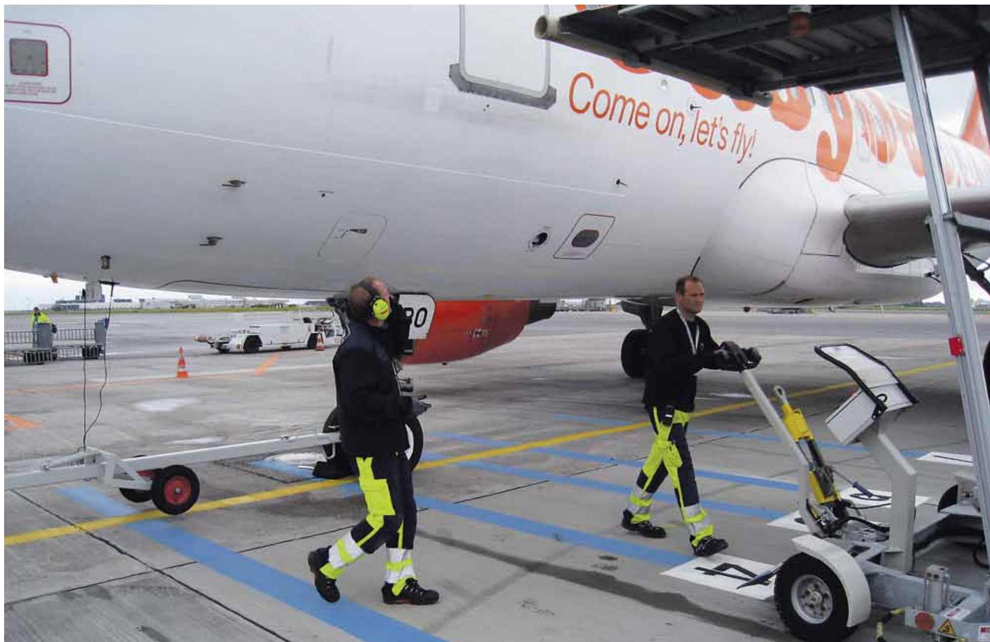
På GO-terminalen er der elektriske trapper, som CPH stiller til rådighed for handlerne.