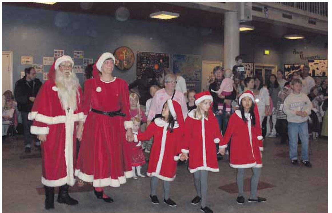
Der er brug for friske kræfter, så det også bliver jul i år.

Denne enighed handler kun om den faste videoovervågning. Det er en kendt sag, at politi og virksomheder har arbejdet sammen om at etablere særskilt skjult videoovervågning, som er brugt i personalesager. De tilfælde er ikke omfattet af denne nye aftale, og den nye fremgangsmåde løser i det hele taget ikke alle problemer 100 procent, men der er taget et stort skridt i den rigtige retning.