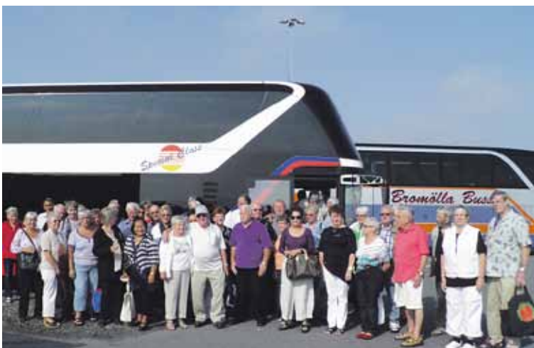
Efterløns- og Pensionistklubben på tur til Lübeck