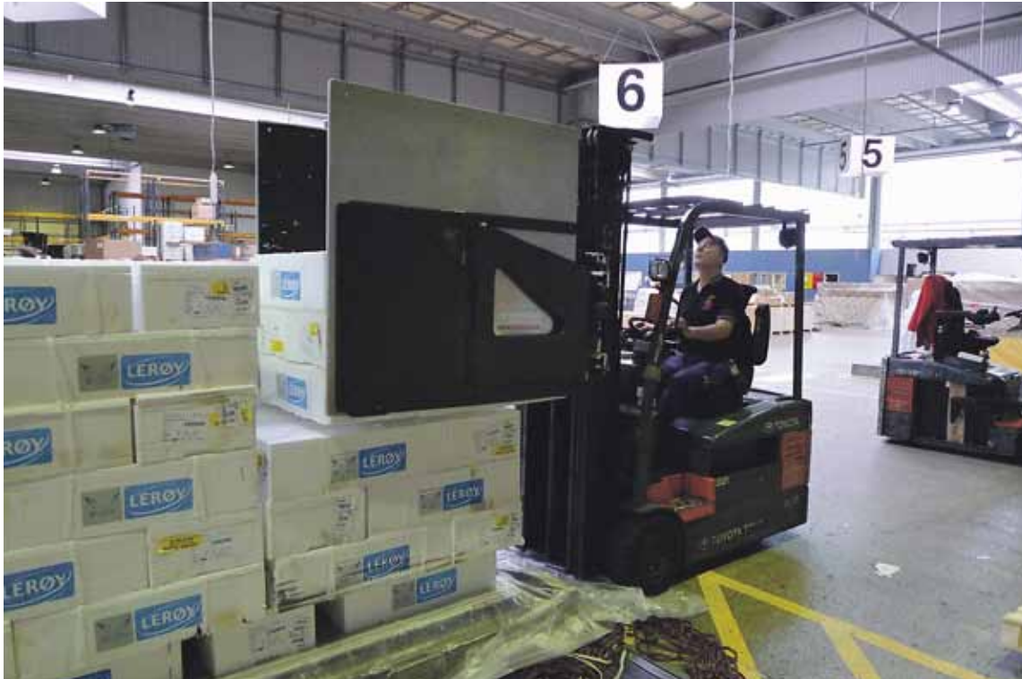
Denne klemtruck har sparet de ansatte hos Spirit Air Cargo for rigtig mange kilo

To nye trucks giver bedre arbejdsmiljø hos Spirit Air Cargo.