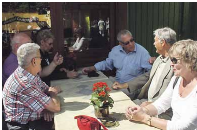
Efterløns- og Pensionistklubben på skovtur.

I år gik turen til Lyngby båd fart, hvor der var lejet to både, som sejlede en smuk tur i Lyngby sø og Mølleåen.