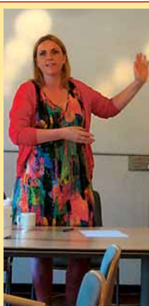
Politiker-møde 3F Kastrup havde indbudt tre folketingsmedlemmer til debat om fremtiden Læs mere på side 8