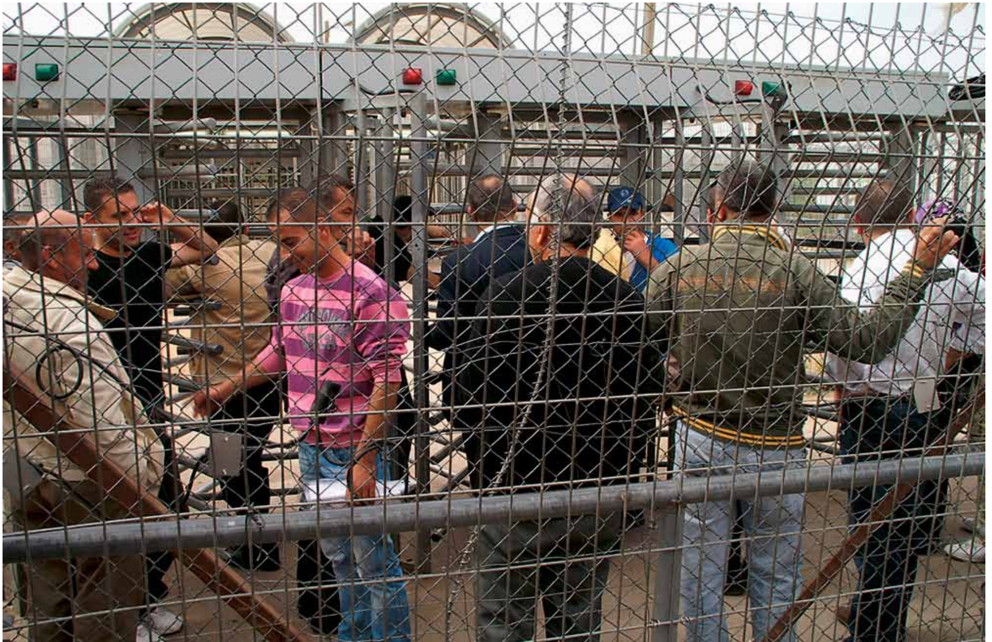
Palæstinensiske arbejdere venter på at komme over grænsen til Israel, så de kan komme på arbejde.