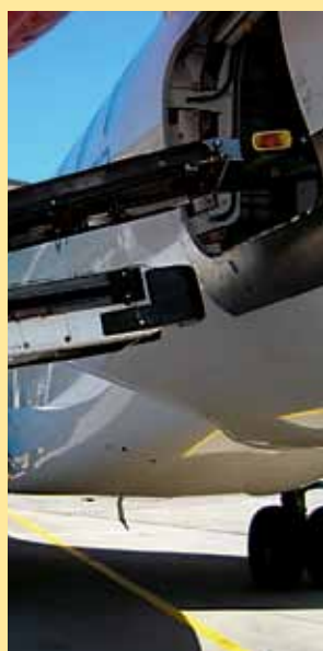
Ny teknik Aalborg Lufthavn er godt med på den teknologiske udvikling Læs mere på side 9