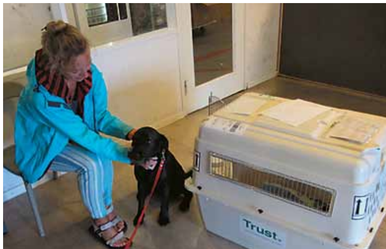
WFS pakker lidt af hvert. Hunden her skal til Canada.