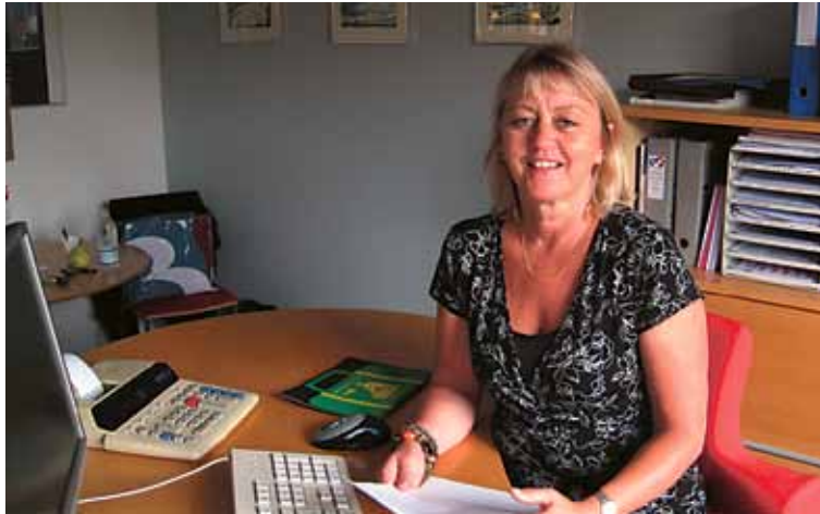
Regeringens kriseplan rammer de arbejdsløse hårdt. Dagpenge-perioden bliver halveret og det bliver sværere at optjene ret til dagpenge.

Regeringen og Dansk Folkeparti har halveret dagpenge-perioden fra fire til to år. Det kan få store konsekvenser.