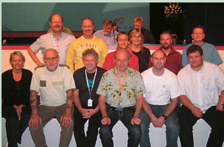
Holdet fra 3F Kastrup ved 3F's seneste kongres i 2007.

ligger TR-uddannelsen os meget på sinde. Vi oplever, at grunduddannelsen er blevet nedprioriteret til fordel for mere sofistikerede kurser. Det duer ikke, hvis vi skal holde liv i vores fødekæde af