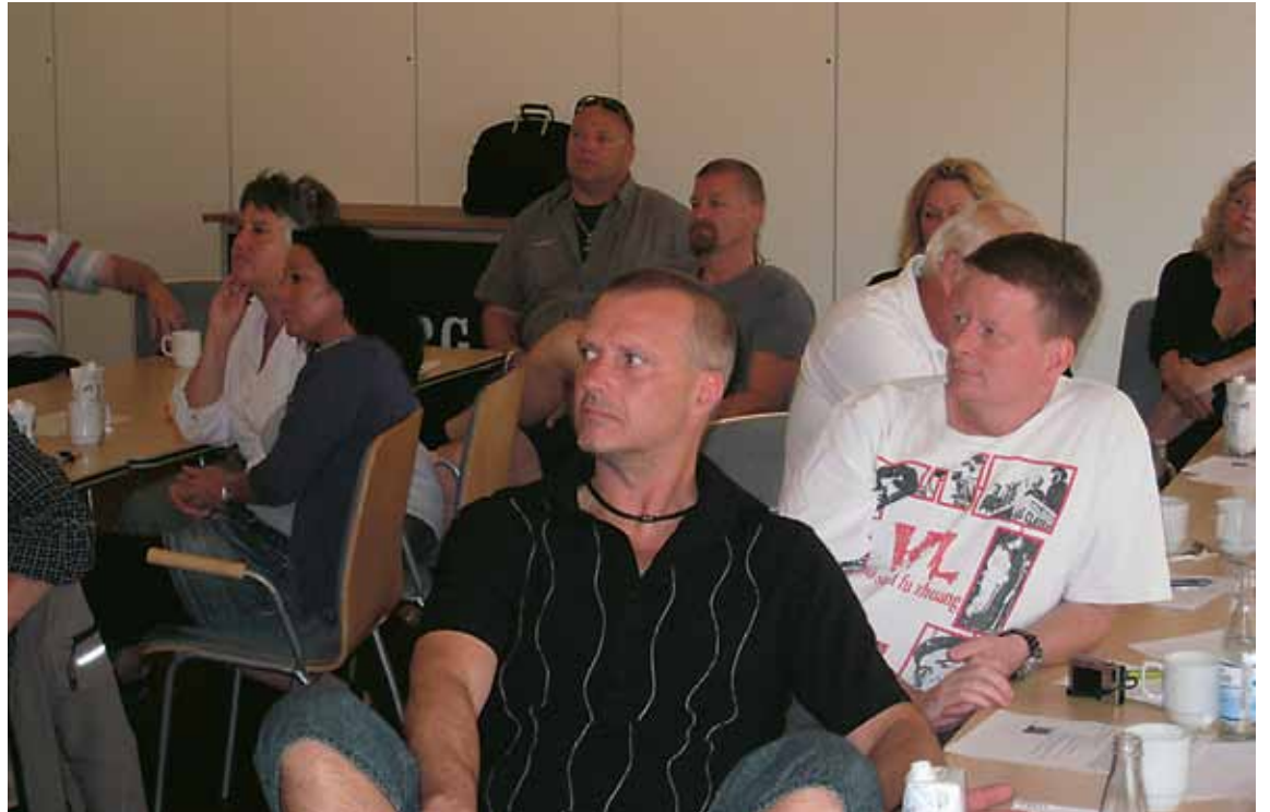
Der blev lyttet intenst til de tre politikere. Der var godt gang i diskussionen.

Derudover undrede hun sig over, hvad er det for nogen jobs der kommer af at piske de arbejdsløse.