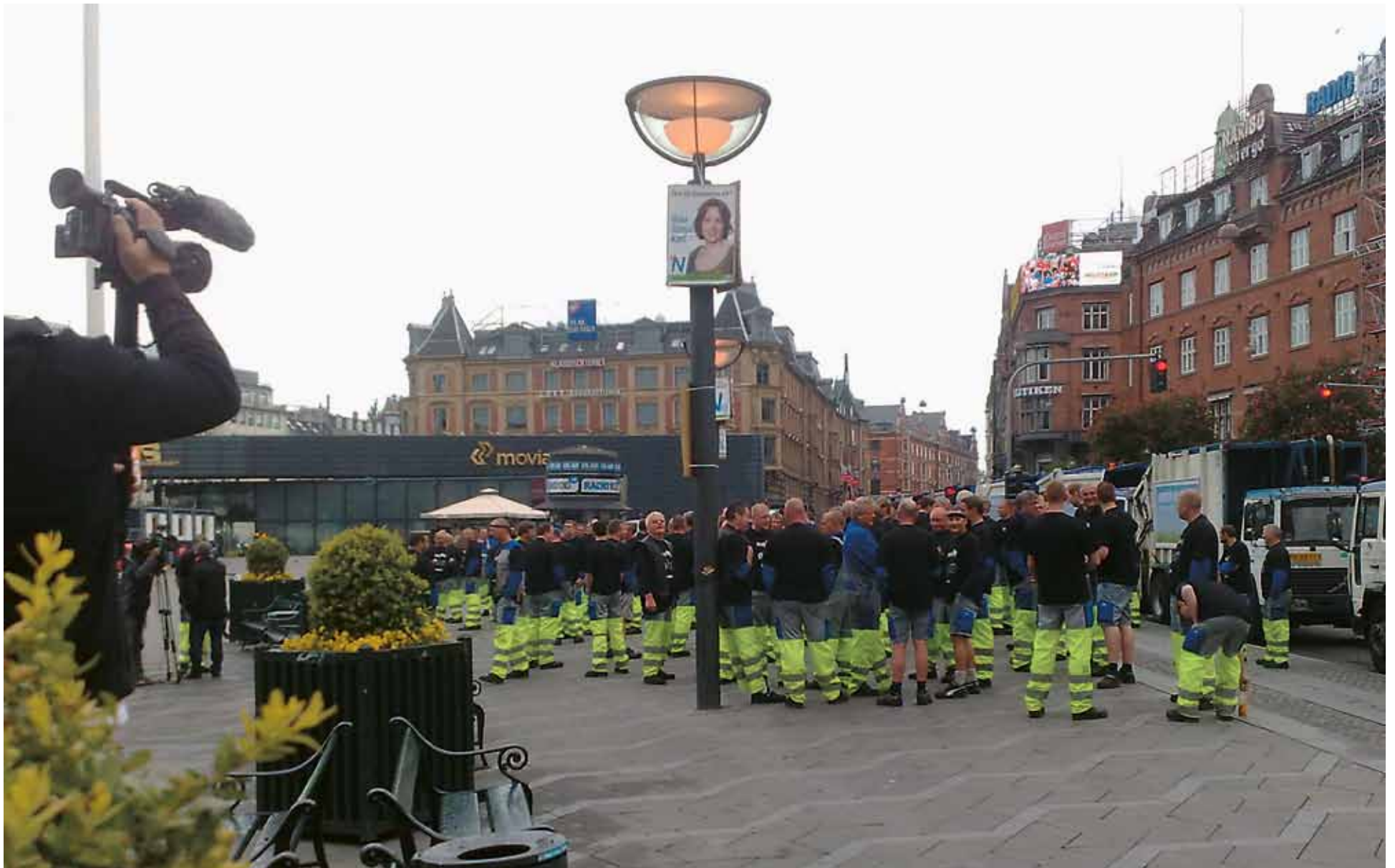
En del af de tidligere ansatte hos R98 undgår at møde et nyt sted efter udbuddet. Om de skal mødes på Rådhuspladsen, vil tiden vise.