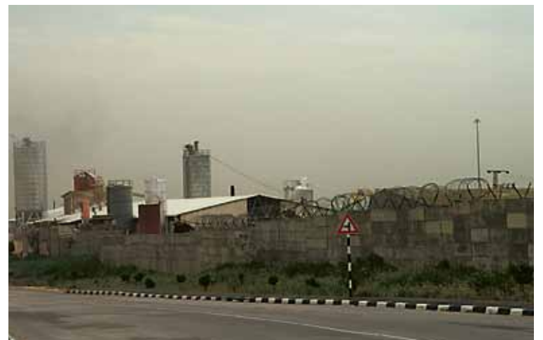
En af syv giftfabrikker på Vestbredden, som ligger klods op af hinanden. Muren er bygget uden om fabrikkerne, således at de nu ligger på palæstinensisk område. Israels højesteret har afgjort, at når vinden blæser fra vest mod øst – altså ind over Vestbredden, må fabrikkerne arbejde. Blæser vinden fra øst mod vest – dvs. ind over Israel, må de ikke arbejde, og arbejderne må sendes hjem.