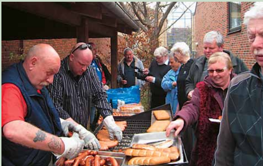
Dejlig 1. maj fest hos 3F Kastrup med rigtig mange glade gæster.