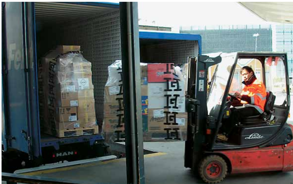
Varene kommer fra Heinemanns centrallager i Hamburg to gange dagligt.