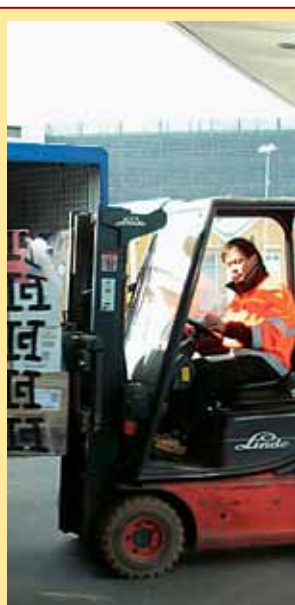
Heinemann – lille arbejdsplads med gode kollegaer Læs mere på side 6-7